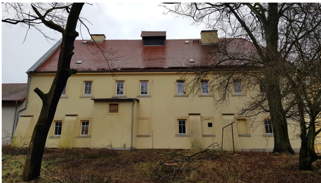
Fot. 03. Elewacja tylna