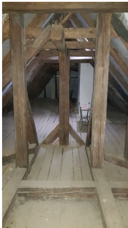
Fot. 08. Elementy więźby dachowej