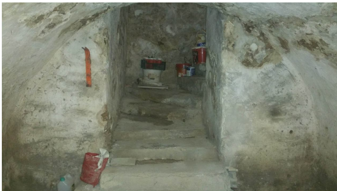
Fot. 05. Schody w poziomie piwnicy