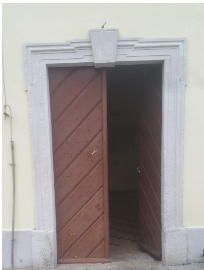
Fot. 04. Drzwi wejściowe