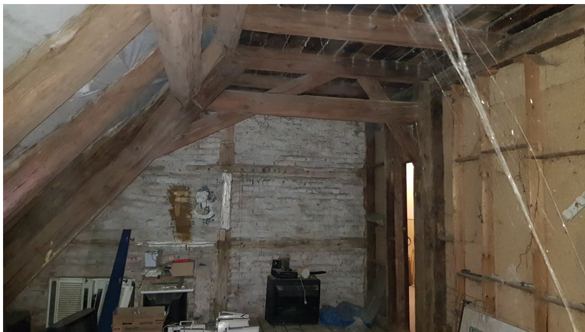
Fot. 09. Elementy więźby dachowej