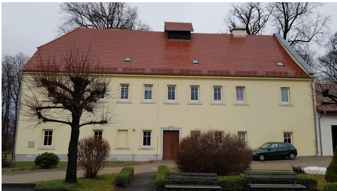
Fot. 01. Elewacja frontowa