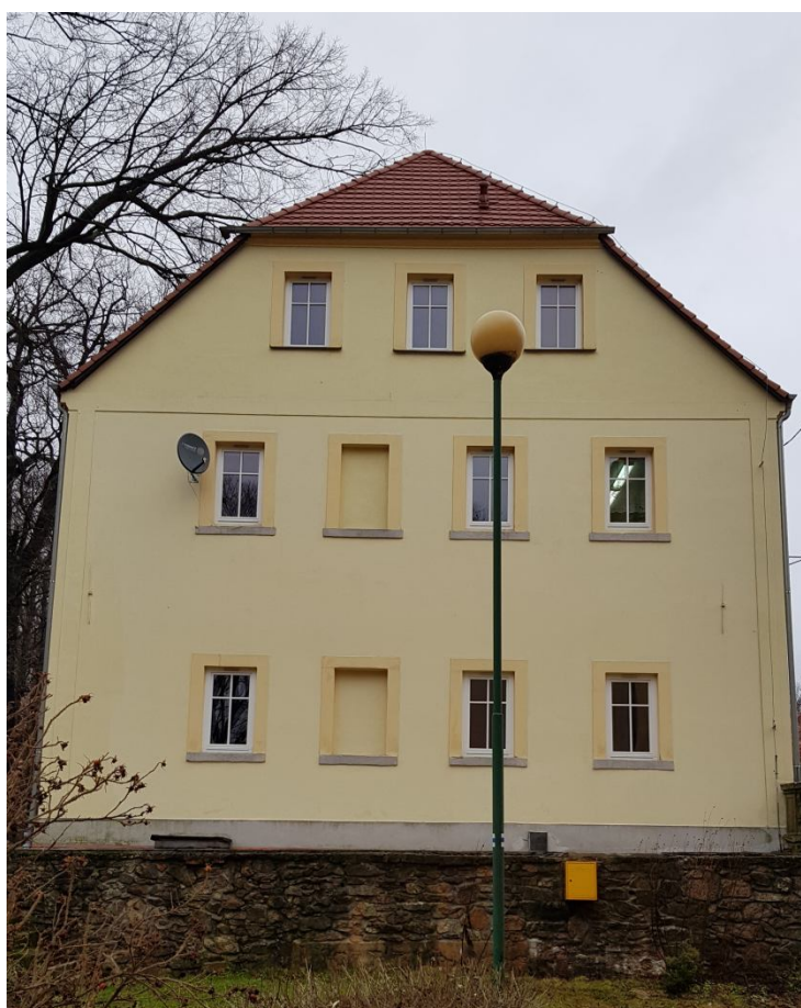
Fot. 02. Elewacja boczna